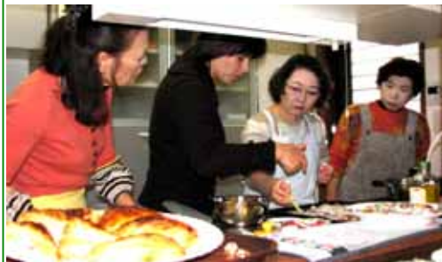
リュボフさんの指導を受け真剣に料理に取り組む