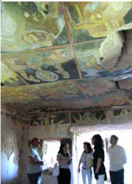
教会内部に描かれた見事な彩色の壁画