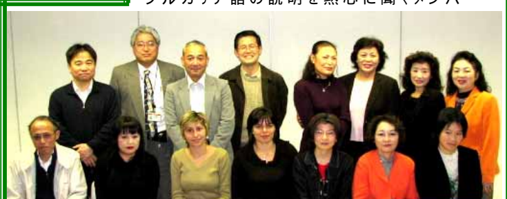
第3期第4回・ブルガリア理解講座の後に記念の写真に