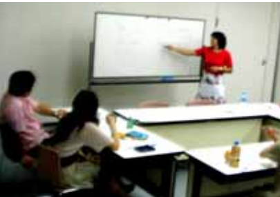
特別会員・リュボフさんによるブルガリア語教室

同合唱団の広島市入りは初めて。メンバーは美しいブルガリア女性18人の合唱、総指揮、演奏の総勢25人。午後7時から公演に先立ち、3時からの交流会が開かれた。歓迎交流の場、