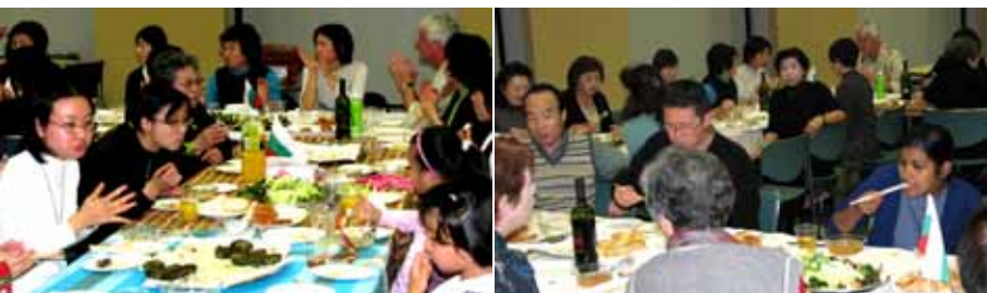
会館に住んでいる中国人(左写真)のやスリランカ人の家族(右写真)を招待し楽しく懇談

この日は「本番」も大丈夫 12月2日の「本番」も大丈夫 リュボフさんの指導を受け、試作会を行いました。料理の味は、試作会で少し試してみましたが、大成功でした。料理の味は、試作会で少し試してみましたが、大成功でした。