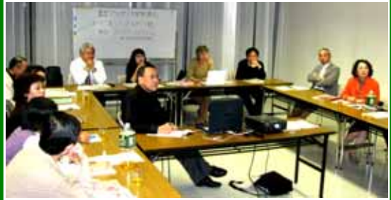
ブルガリア語の説明を熱心に聞くメンバー