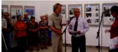
ダミアノフ市長が核兵器廃絶と平和構築を討る