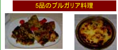
5品のブルガリア料理