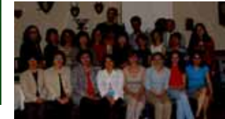
日本語学科学生と交流