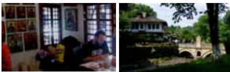
伝統家屋を集めたてブルガリアの昔の生活文化を体