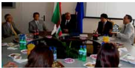
ダミヤノフ市長と原爆展の開催で意見交換