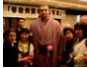
中村会長叙勲パーティーと大関・琴欧洲励ます会に友情参加(4日)