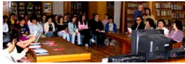
日本語学科の8,9(中学2,3)年生、約30人と日本語で交流