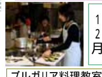
ブルガリア料理教室