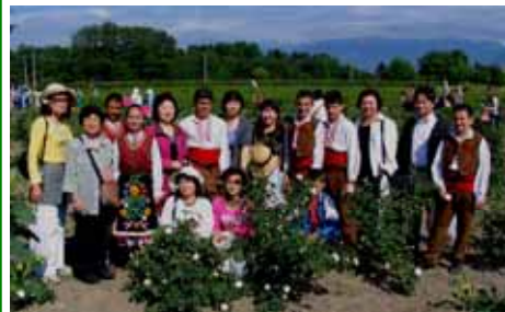
青空の下での ばら摘み体験