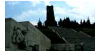
ブルガリアの独立を果たした露土戦争でオスマントルコ軍との雌雄を決定したシブカ峠の自由記念碑