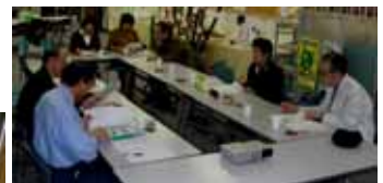
第10回・理事・幹事会(26)