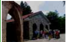
石造りの建物で保護されている世界遺産・トラキア人の