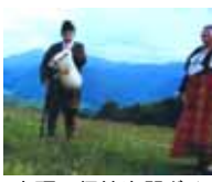
山頂で伝統楽器ガイダ(バグパイプ)に合わせて歌