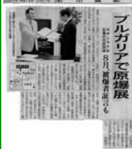
原爆展開催を報道した中国新聞(5月27日付)