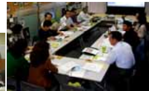
第2次・訪問団報告会、第9回・理事・幹事会(10日)