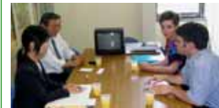
JICA研修生と県国際ビジネス促進室(29日)