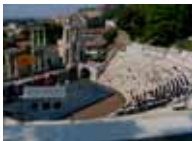
円形競技場の遺跡