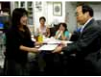
ヤマオコーポレーションに感謝状(28日)