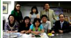
第1次・訪問団の懇談会(28日)