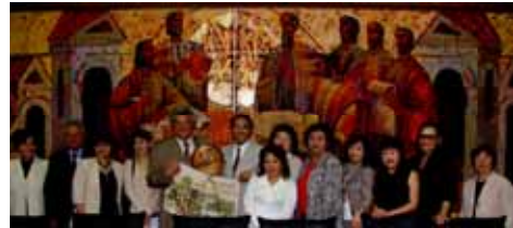
イヴァン学長と日本語教師派遣で意見交換