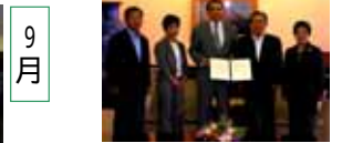
山田助役に出発挨拶(25日)