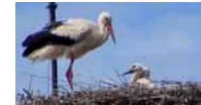
屋根上で子育てをするコウノトリ