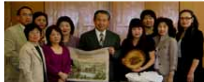
福井大使から国際交流について意見を聞く