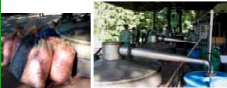
早朝に摘まれたばらの花びら