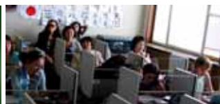
大学の日本語学科の授業風景