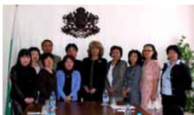
大統領府でトシコヴァ官房長と