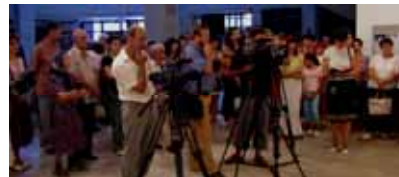
テレビや新聞などのマスコミが取材、全国に報道