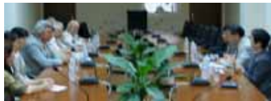
イヴァン学長と再会し日本語教師派遣で意見交