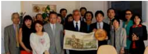
原爆展の8月開催を確認した後に記念撮影