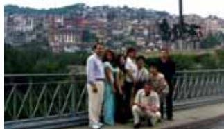
溪谷に立ち並ぶヴェリコの家並み