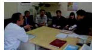
病院長と意見交換