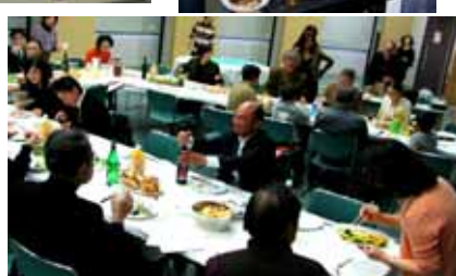
料理とワインを楽しむ会(10日)