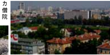
人口約37万人のプロブディフの町並み