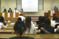
広島大学日本語学科20周年記念に参加(23日)