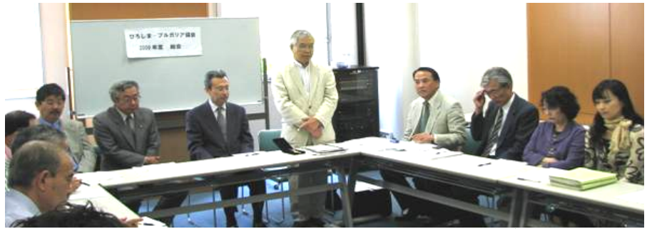
(財)ひろしま国際センターの平川事務局長次長や(財)広島平和文化センターの本多常務理事、浅野顧問などを迎えて開かれた「2009年度・総会」