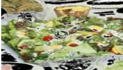
完成したヨーグルトと野菜を多く使った健康食のブルガリア料理