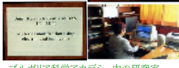
ブルガリア科学アカデミー内の研究室