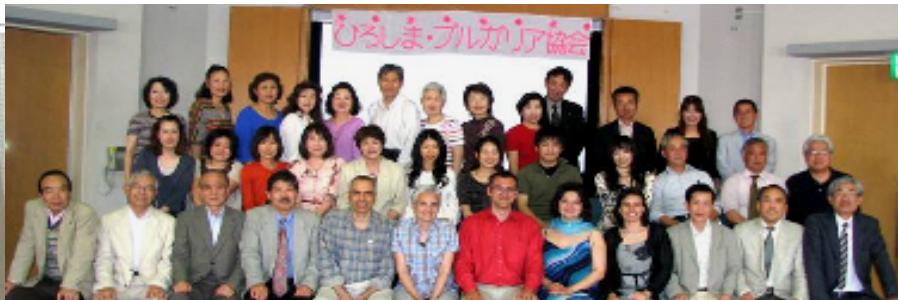
ブルガリアの料理とワインを楽しんだ後に、残っていた人たちが記念撮影