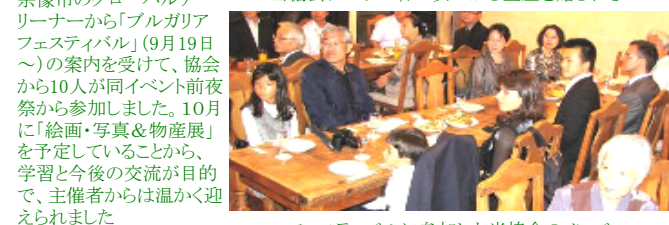
フェスティバルに参加した当協会のメンバー