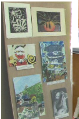
ブルガリアに贈る広島紹介の絵画・書等展の入賞作品を展示