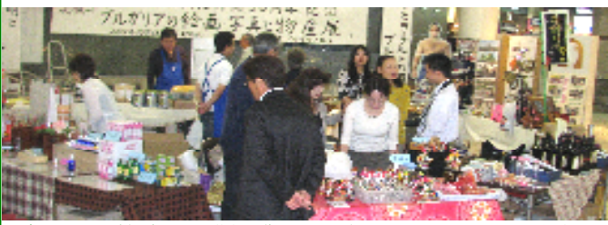
ブルガリア乳幼児施設への薬代を集めるローズ・オイルなどのチャリティー物産展