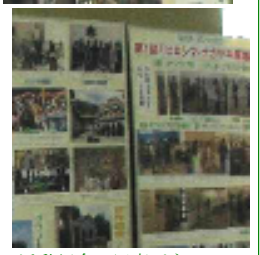
活動紹介の写真パネル