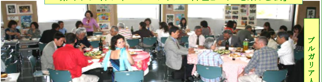
ブルガリア人3家族も参画し、ヨーグルトを使った健康食・ブルガリア料理を味わい、美味しいブルガリア・ワインを楽しむ参加者ら