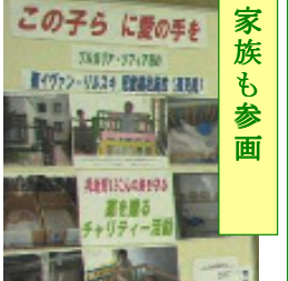
ブルガリアの乳幼児施設へ贈る募金活動も