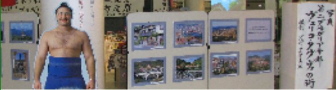
ブルガリアから贈られてきた「ヴェリコ・タルノヴォ紹介の写真」40枚