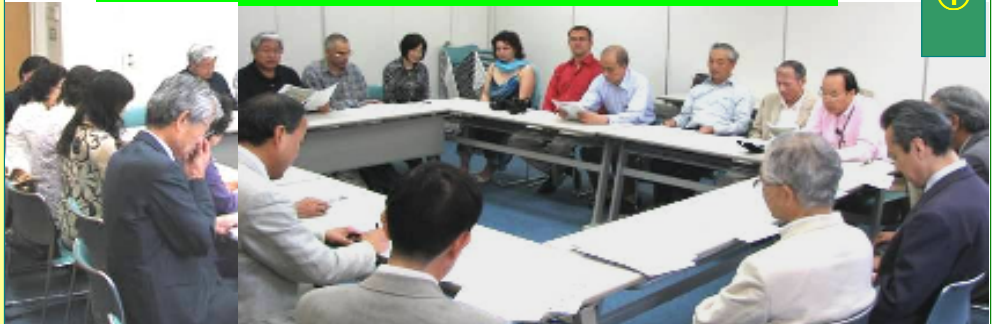
第6次・ブルガリア訪問団の派遣やブルガリアの乳幼児施設に薬代を贈るチャリティー活動方針などを真剣に検討