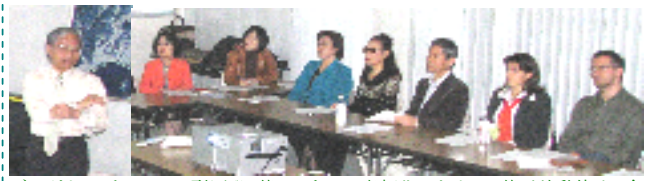
ブルガリアにあるロシア型原発6基は、すでに老朽化のために4基が稼働停止。今後は、原発の廃棄処分が課題になり、日本などの協力が必要になる、という