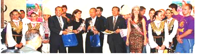
当協会にバラの谷の女王から土産を贈られる