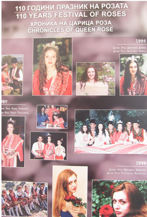
ばらの女王の歴史を紹介するポスター