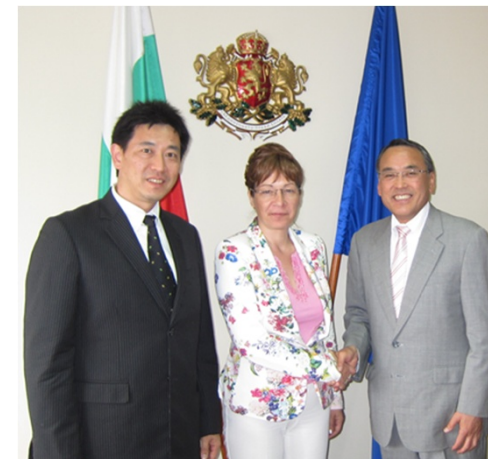
意見交換後に記念写真に