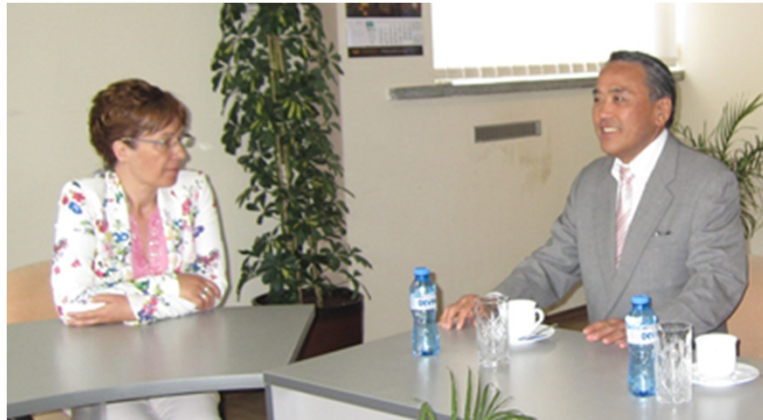
経済交流の推進を説明する