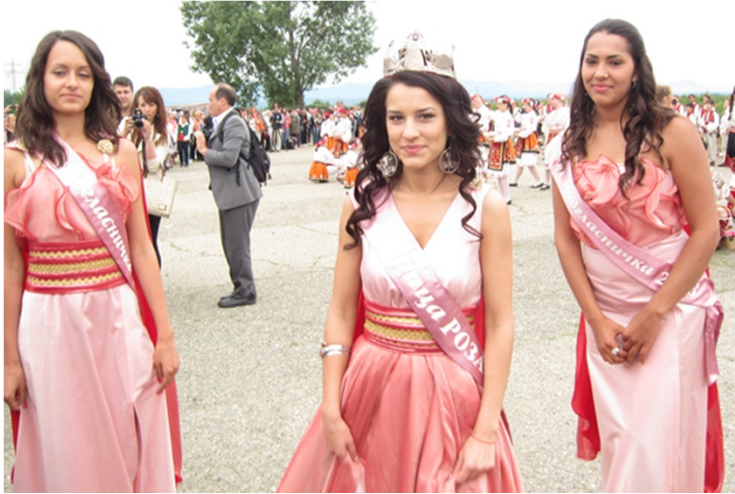
ばらの女王と準バラの女王ら