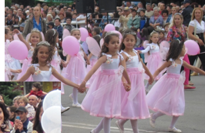
未来のばらの女王候補