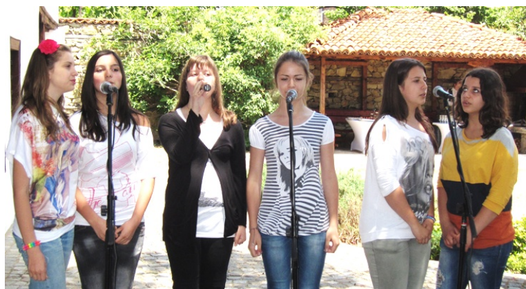
ブルガリアの歌で歓迎する女性