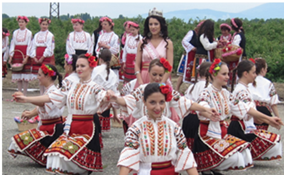
美しいばら摘み女性の中から ばらの女王が