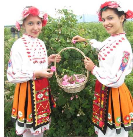
ばら摘みのデモをする少女