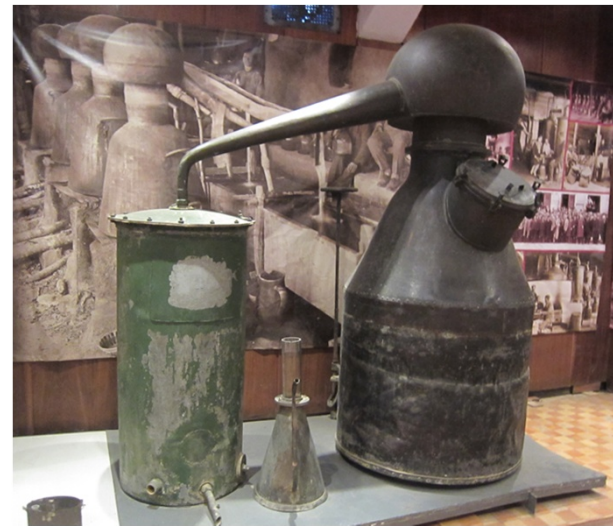
昔のローズオイル精油機