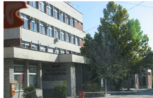
カザンラック市役所