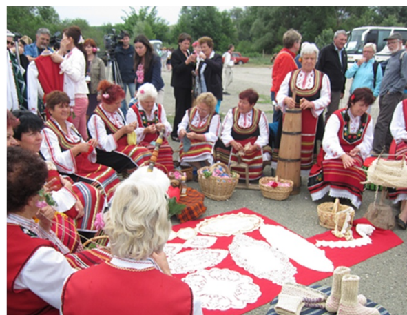
野外舞台ンお周りには刺繡制作も