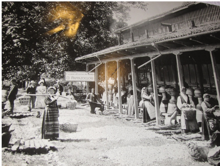
昔のローズオイル精油工場