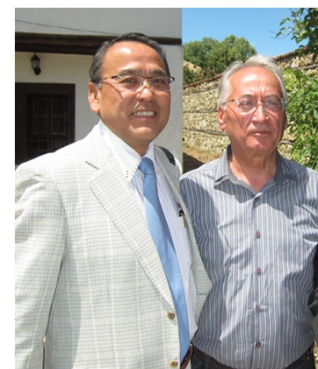
ダミアノ 前市長に再会