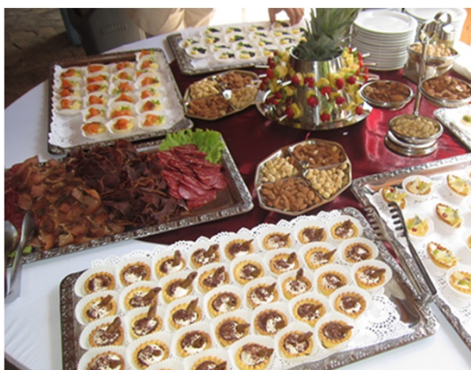
ワインやクッキー、フルーツ