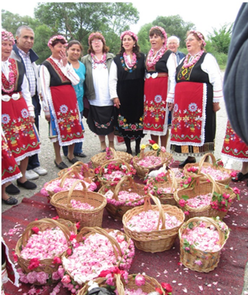
摘み取った ばらの花びら