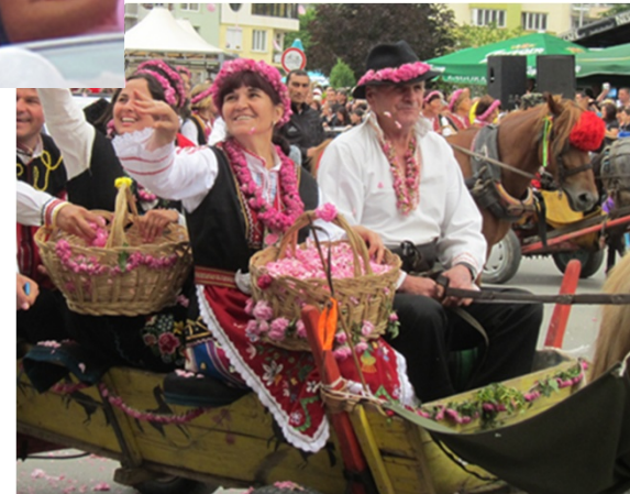
ばらの花びらとローズオイルを振り掛ける