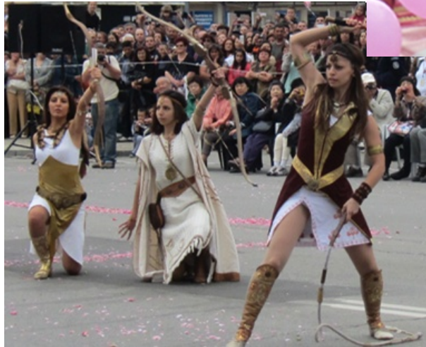
かつての騎馬民族の女性剣士