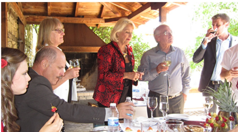
フランスの代表者などと懇談