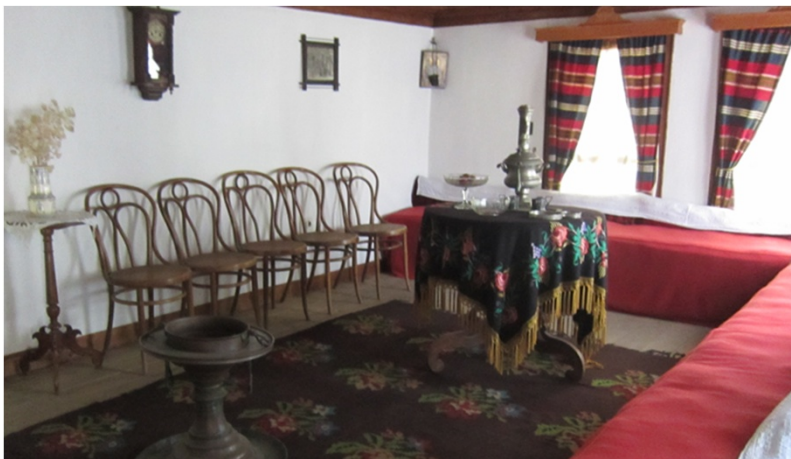
ベットのような腰掛を2方に造った応接間