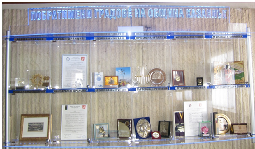
市長室前に展示されているカザンラック市の友好都市や団体からの記念品