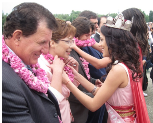
市長らに花輪をかけるばらの女王