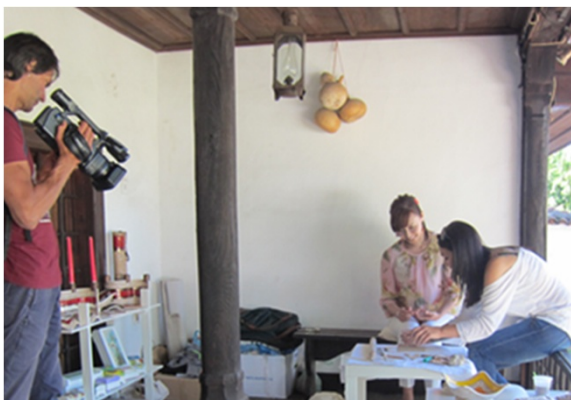
奥さんをモデルにブルガリア紹介のビデオを撮影する日本人