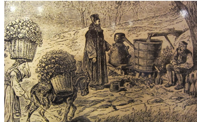
大昔のローズオイル精油風景