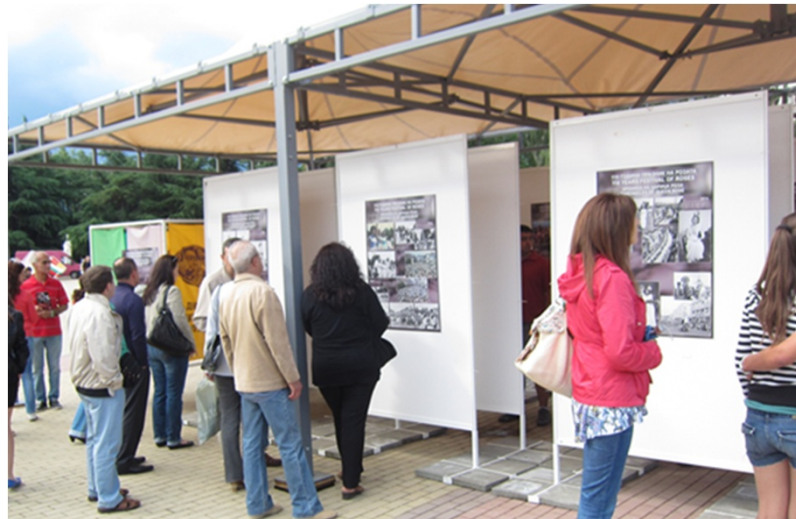
ポスターを見る市民や観光旅行者