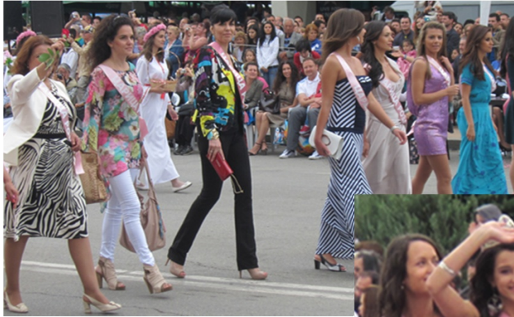
歴代のばらの女王の行進