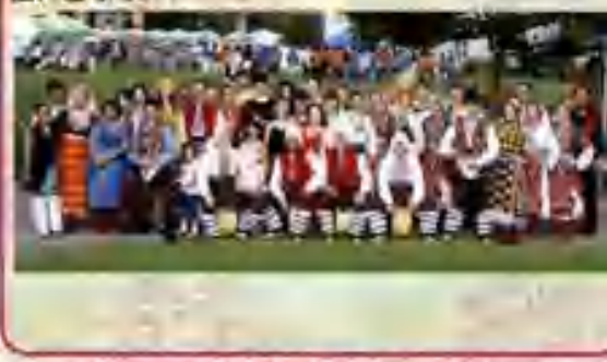
ワールドフェスティバルの様子

世界中の食文化とパフォーマンスの大披露会。留学生とプロのシェフが作った舞台料理、そのサポートに駆けつけた宗像市民の情熱、珍しい音色の旋律が芝生の上に漂う。色鮮やかな民芸品もこの日の思い出にどうぞ。