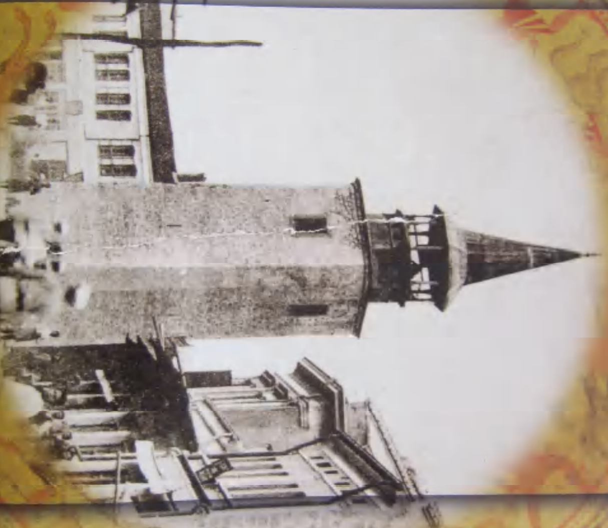
ハスコヴォ市の古い時計台